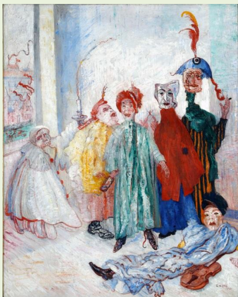
James ENSOR (1860 - 1949), Zonderlinge maskers, 1892, Olieverf op doek, 100 x 80 cm, Brussel, KMSKB

Op 6 december 2013 opende het Musée Fin-de-Siècle Museum de deuren en kan het publiek kennismaken met een uitzonderlijke verzameling werken van Belgische kunstenaars als James Ensor, Fernand Khnopff, Léon Spilliaert, Victor Horta, Henry Van de Velde en Philippe Wolfers, maar ook van buitenlandse kunstenaars als Paul Gauguin, Auguste Rodin, Pierre Bonnard, Emile Gallé, Louis Majorelle en Alphonse Mucha.