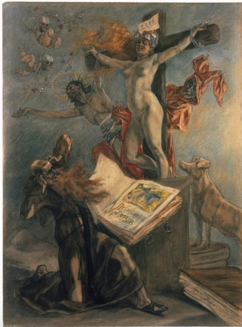
Félicien ROPS (1833 - 1898), De verzoeking van Sint-Antonius, 1878, Kleurkrijt, 73,8 x 54,3 cm, Brussel, KBR

De grote pasteltekening De verzoeking van Sint-Antonius ' van Félicien Rops zal een blikvanger vormen in de openingsopstelling. Rops geldt als een voorloper en wegbereider van het symbolisme dat rond de eeuwwisseling in zwang was. Tijdens zijn kunstenaarsloopbaan was hij zeer bedrijvig als tekenaar. Naast zijn complete grafische oeuvre bezit de Koninklijke Bibliotheek een grote collectie brieven in het Handschriftenkabinet en een rijke collectie tekeningen en pastels van zijn hand.